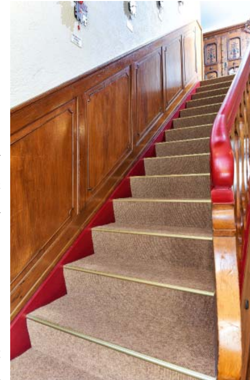
Abb. re unten: tretford, Farbe 555

Durch seine hohe Trittschalldämmung sorgt tretford PLUS 7 für mehr Ruhe. In einer Welt, in der wir immer mehr Geräuschen ausgesetzt sind, ist ein textiler Belag ein guter Helfer: Er dämmt den Lärm und schafft dadurch eine angenehmere Raumatmosphäre – jetzt auch im Goldenen Engel im Glottertal.